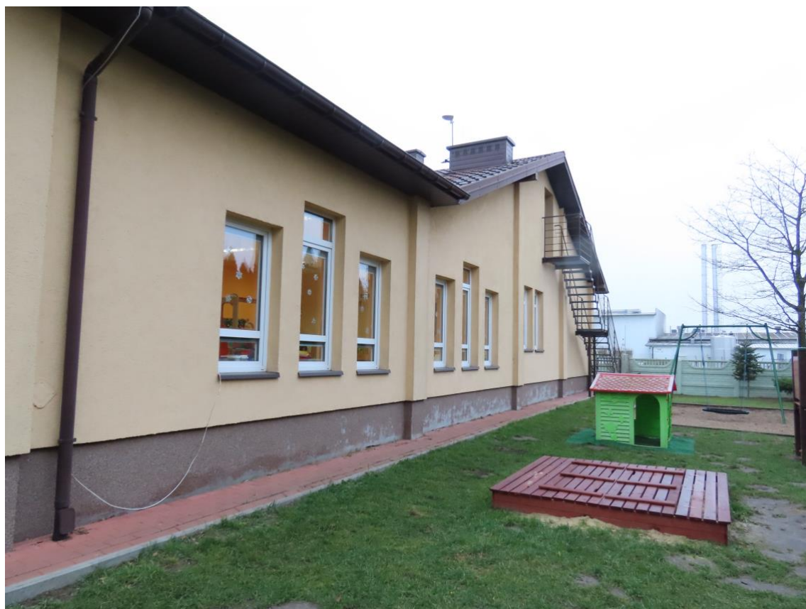
Fot. 3. Elewacja zachodnia z wejściem na strych.