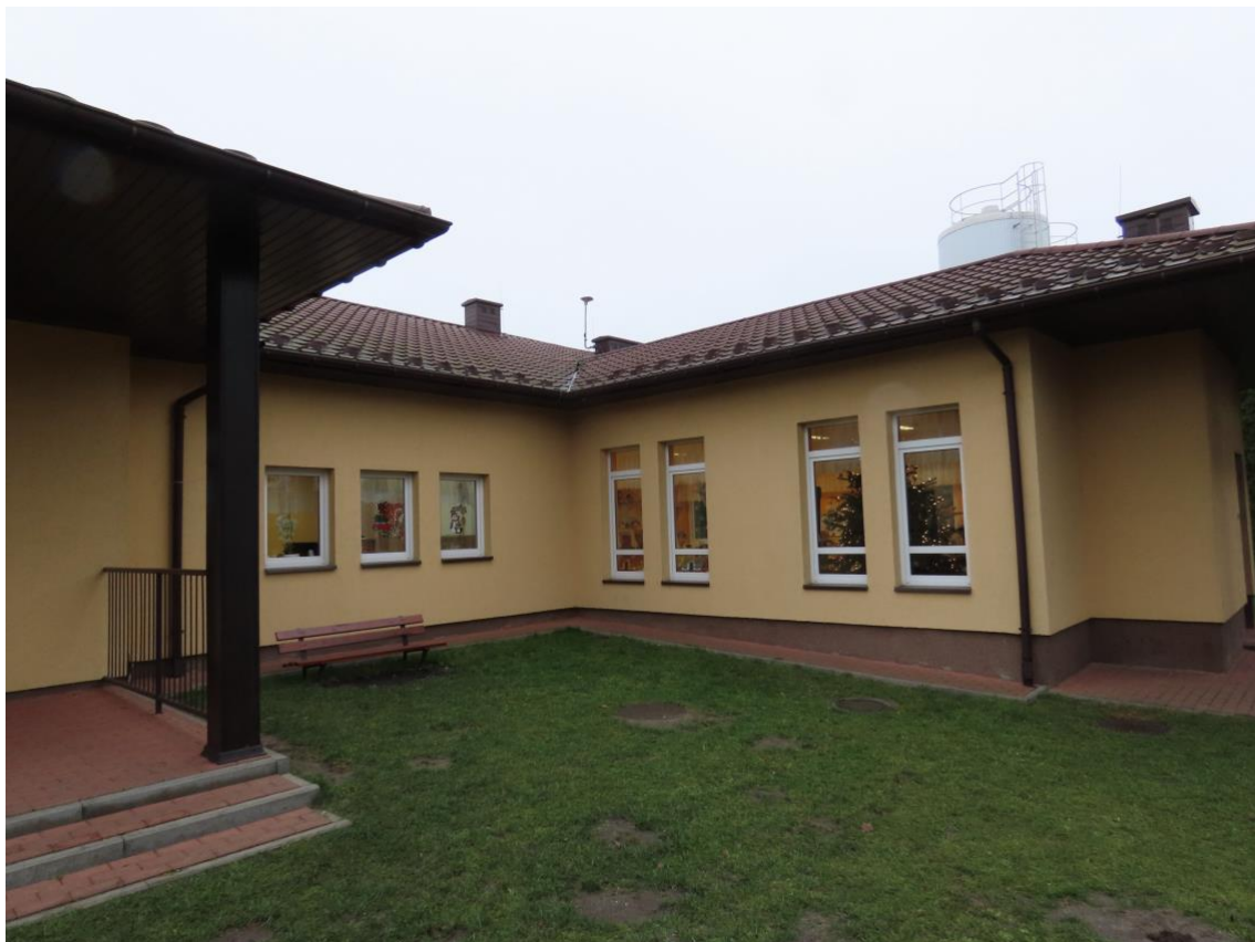
Fot. 2. Elewacja frontowa, od strony placu zabaw.