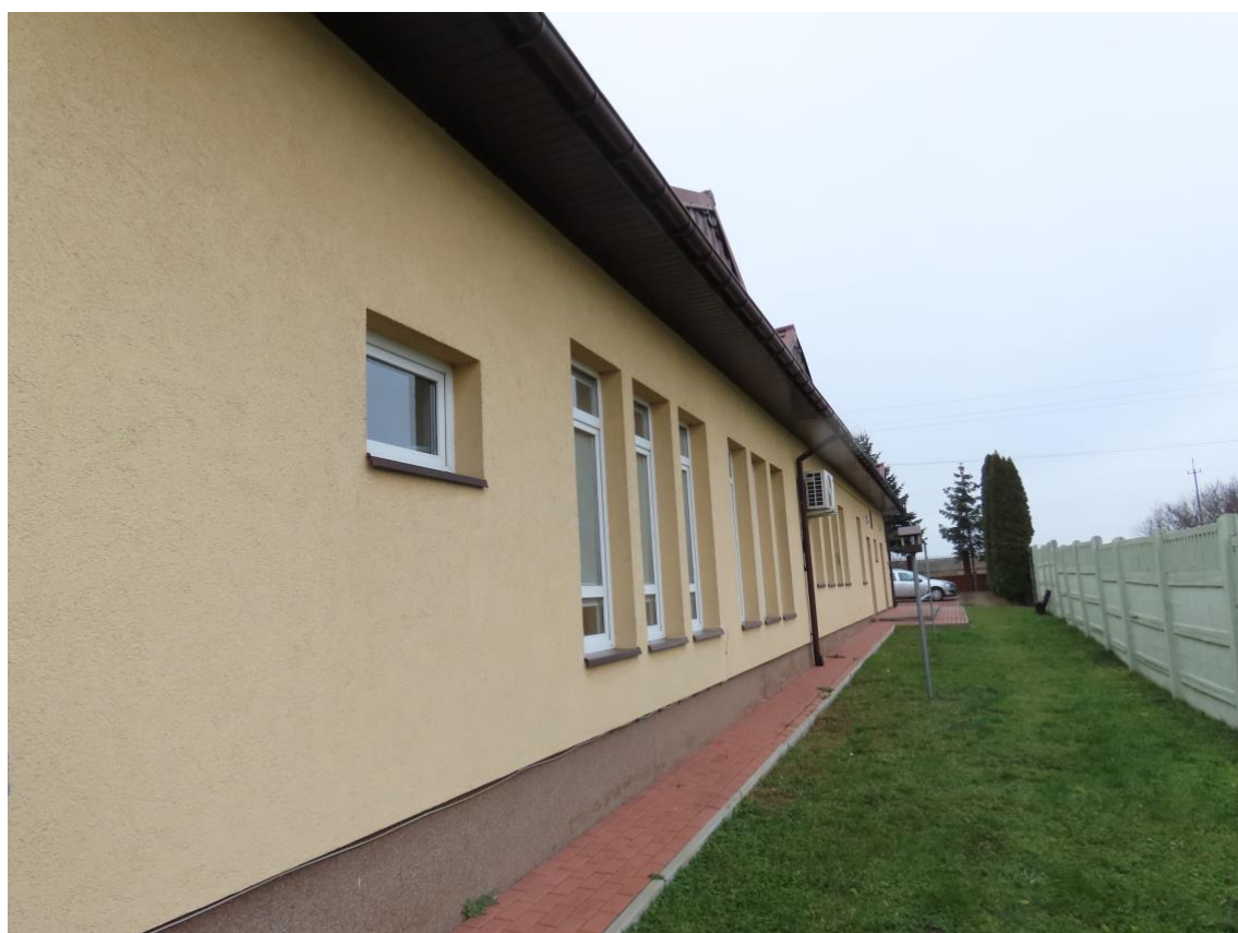
Fot. 6. Elewacja od strony zakładów Agros-Nowa.