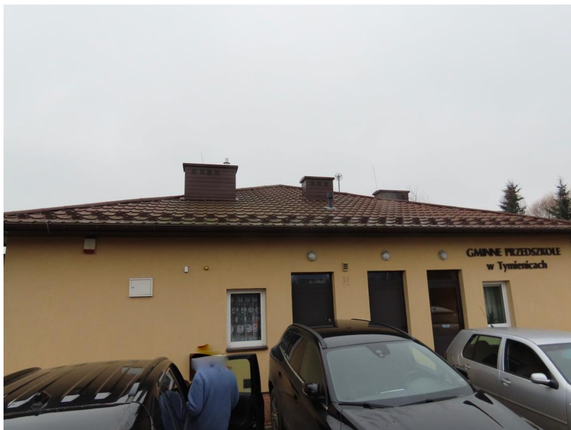
Fot. 5. Elewacja przedszkola od strony ulicy.