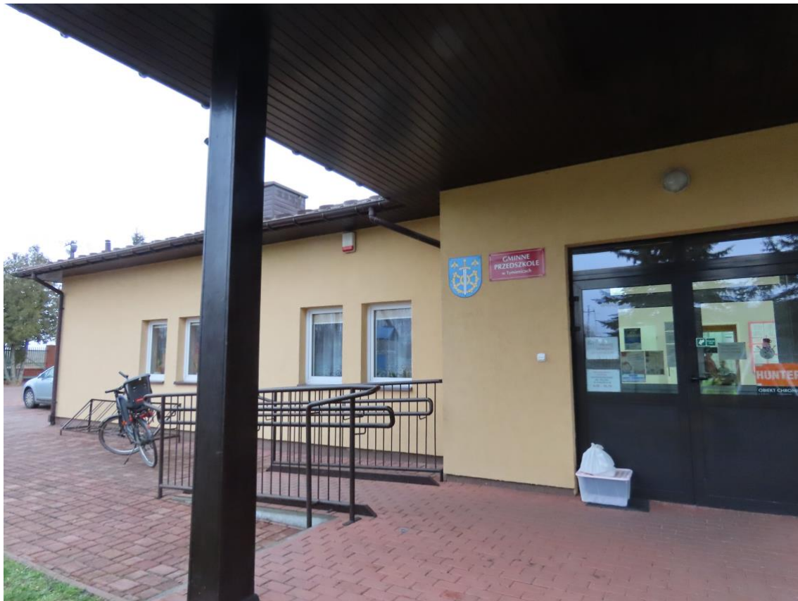
Fot. 1. Budynek Gminnego Przedszkola w Tymienicach od strony wejścia do budynku.