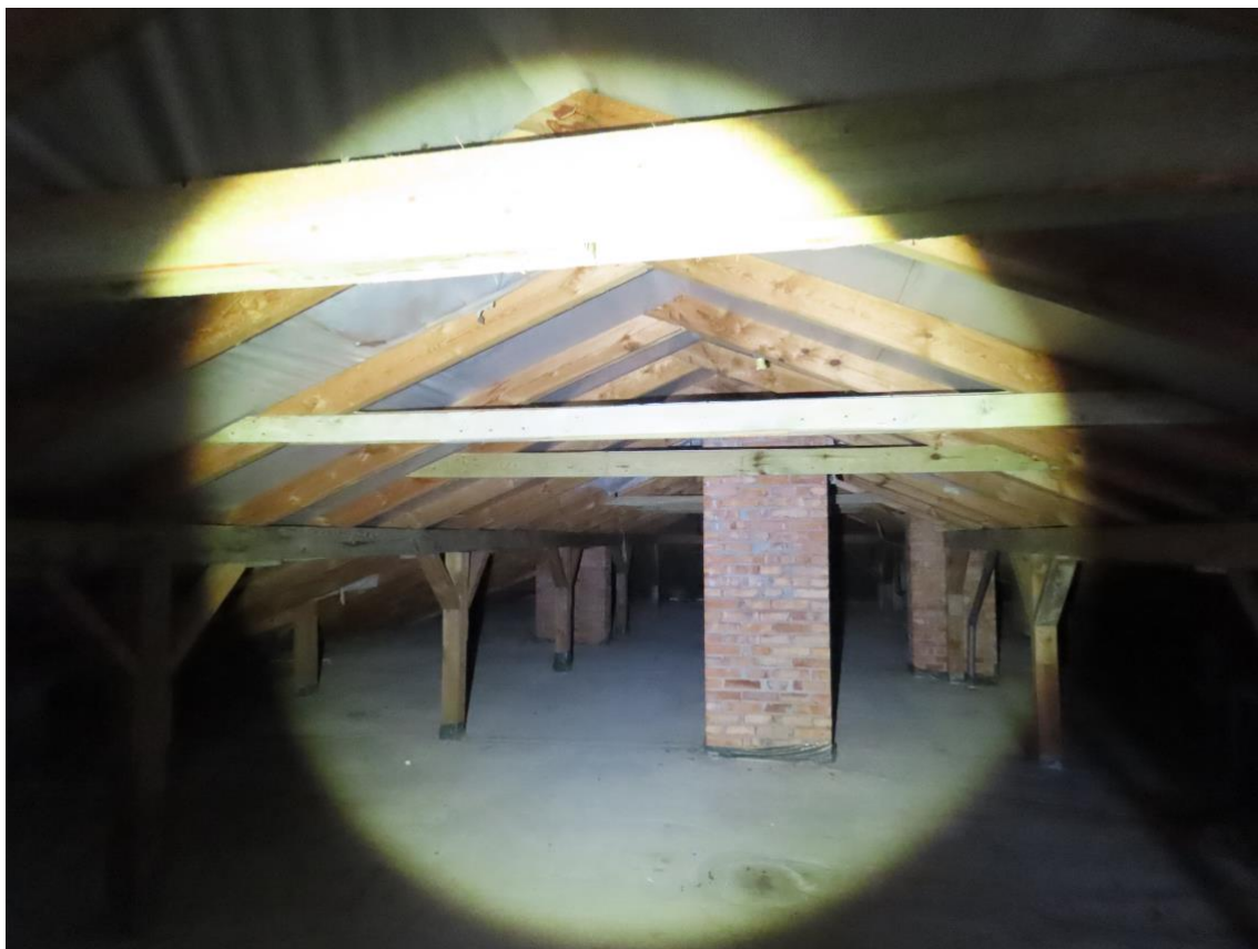
Fot. 7. Strych budynku, brak śladów obecności ptaków i nietoperzy.