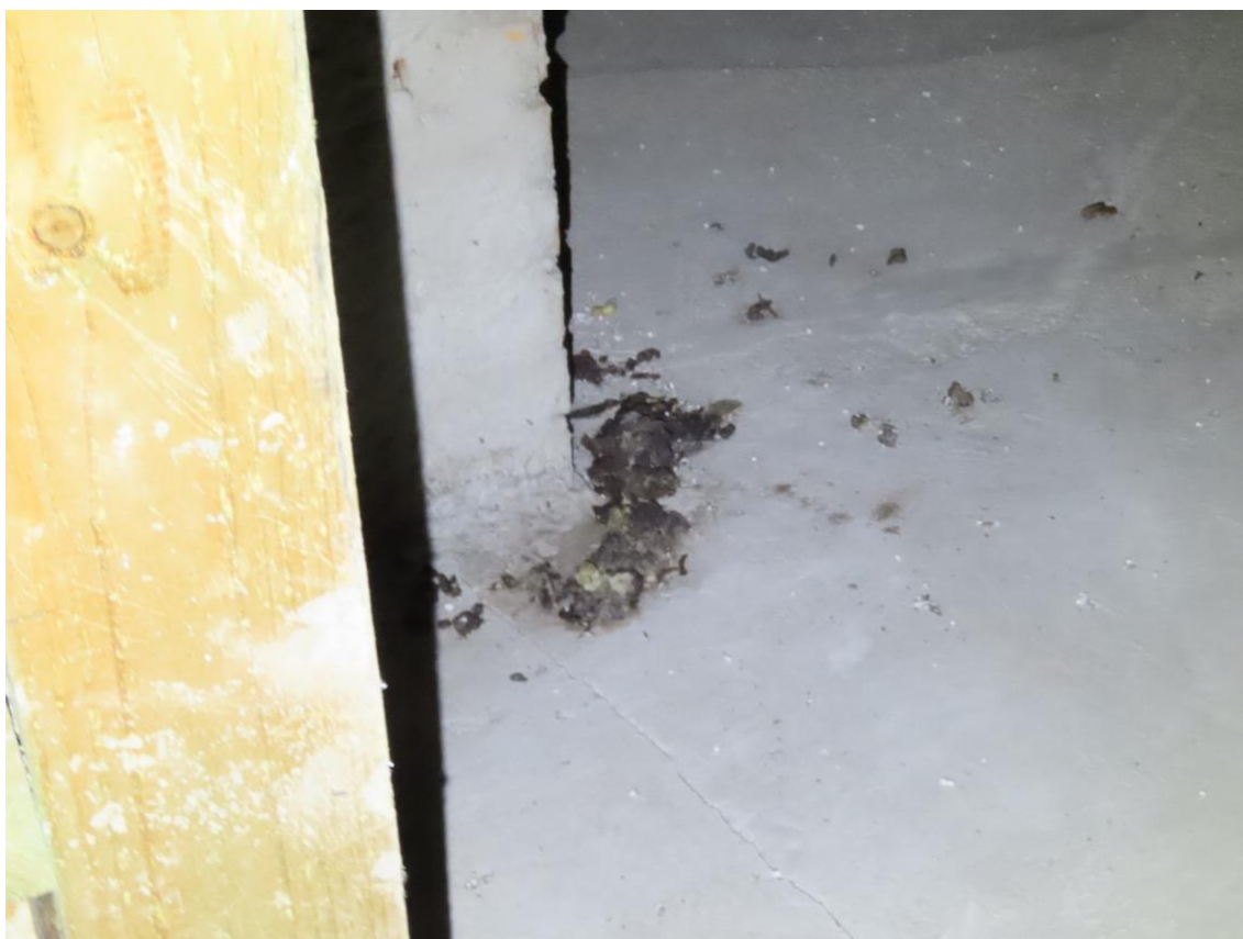
Fot. 8. Toaleta kuny domowej – miejsca, gdzie nagromadzone są odchody.