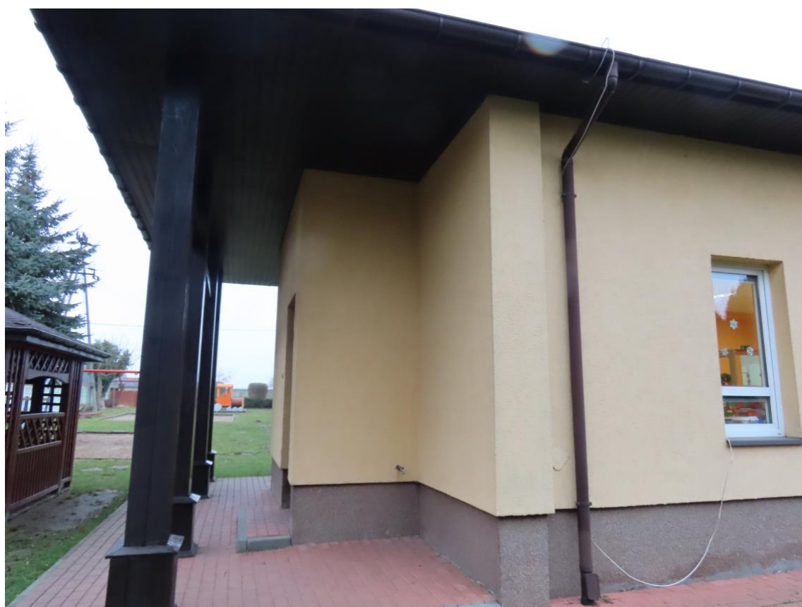
Fot. 4. Narożnik budynku od strony placu zabaw.